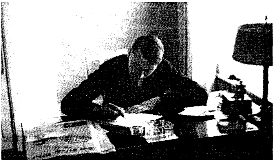
Hitler aan zijn schrijftafel in 1932. Veel Duitse briefschrijvers zagen de dictator als familielid

D e brieven van burgers aan Hitler geven een indruk van de populariteit van de nazidictator onder zijn bevolking. Terwijl de NSDAP-leider voor de machtsovername in 1933 vooral brieven van mannelijke geestverwanten kreeg, al dan niet vergezeld van goedbedoelde adviezen, namen daarna de fanmail en smeekbeden toe. In 1933 bereikten meer dan vijfduizend brieven de Rijkskanselarij, een jaar later zelfs twaalfduizend. Na het begin van Tweede Wereldoorlog werd het in de postkamer een stuk rustiger. Bij zijn laatste verjaardag in 1945 kreeg de Führer minder dan honderd brieven.